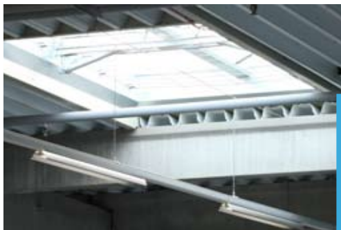
Utilisation de panneaux photovoltaïques en toiture et travail sur l'éclairage intérieur.

La plateforme multimodale permet également de privilégier des moyens de transport à moindre impact environnemental (rail, barge). Le transport fluvial est déjà mis en place pour livrer des containers d'Anvers jusque Douges.